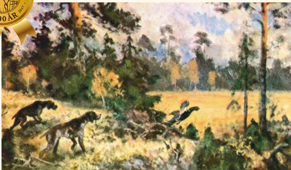
Målning: Lindorm Liljefors