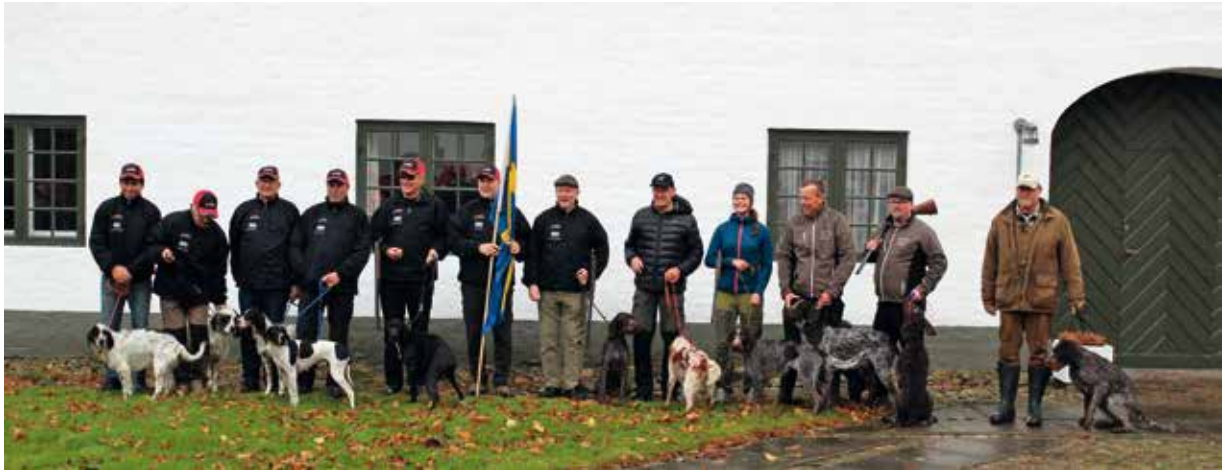
Uppställning av det svenska laget före "avspark".